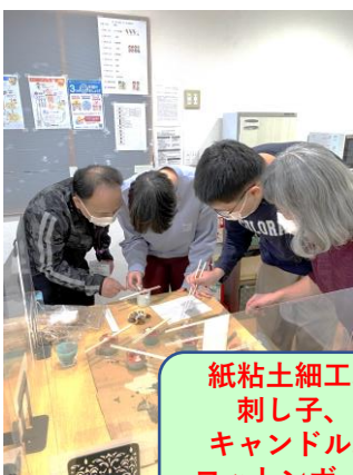
紙粘土細工、刺し子、キャンドル、コットンボール